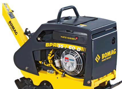
Robust und zuverlässig Bester Komponentenschutz