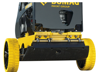
Einfacher und sicherer Transport Transporträder (optional)