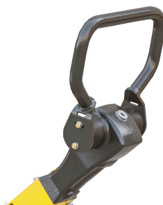
Präzise und sicher bedienbar Komfort-Hebel-Steuerung